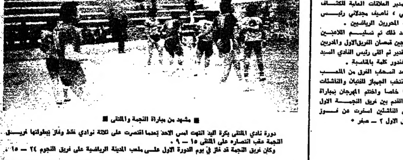
دورة نادي الماتية بكرة اليد انتهت أمس الأحد بعدما اقتضت على ثلاثة نوادي غلط وفاز ببطولتها فريق النجمة عقب انتصاره على الماتية ١٥ - ٩ . وكان فريق النجمة قد فاز في يوم الدورة الأول على ملعب المدينة الرياضية على فريق النجوم ٢٤ - ١٥ .

وبعد انسحاب الفرق من الملعب قدم منتخب الجيزال للفئات والنشطات عرضاً خاصاً واحتفتم المهرجان بعبارة بكرة القدم بين فريق النجمة الأول وفريق الناشئين أسفرت عن فوز الفريق الأول ٢ - ٠ هجر .